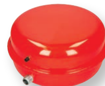
Vaso d'espansione 18L (opzionale)