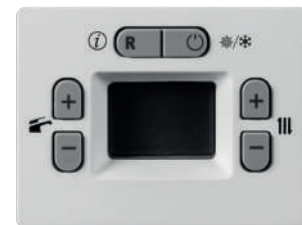
Pannello comandi caldaia

fino a 4 periodi con temperature indipendenti, oltre alla remotizzazione di tutte le informazioni del display caldaia.