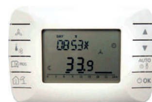
Comando remoto Base